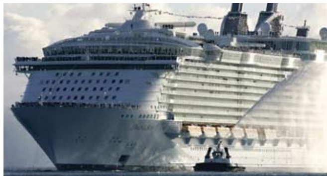
На великане, вес которого составляет 225 282 тонн, оборудовано 16 палуб для пассажиров. На борт судно берет 6 292 пассажиров и 2 165 членов экипажа.

В свое первое плавание «Оазис морей», стоимостью в 1,4 млрд. долларов США (3,2 млрд. литов), отправляется 5 декабря сего года. Размер судна ограничивает и его маршрут. Оно сделает остановку в портах Карибского моря Сэнт Мартен и Сэнт Томас и столице Багам Насау. Эти города должны были провести дноуглубительные работы в своих портах и построить новые причалы, чтобы принять «Оазис». Порт Эверглейда построил совершенно новый терминал, который вместил бы толпы прибывших на судне и новых пассажиров.