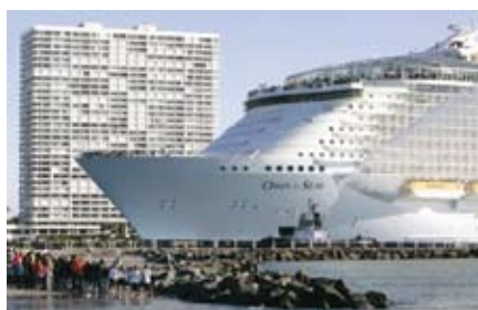
«Оазис морей» - настоящий плавучий курорт, затмевающий окружающие дома во время стоянки в порте Everglide, своем новом доме в юго-восточной Флориде.

Новое судно «Оазис морей» («Oasis of the Seas»), принадлежащий компании «Royal Caribbean», в настоящее время является самым большим, широким, высоким и дорогим в мире круизным лайнером. Специалистам группы компаний «Litana» также довелось принять участие