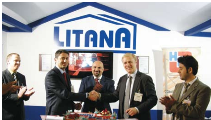
Подписан договор о сотрудничестве.

конструкций. В планах следующего года – еще большее число работников группы «Litana» будет работать в Объединенных