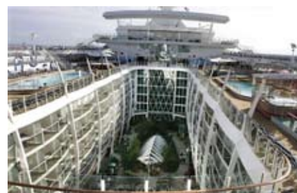
На судне оборудован зал альпинизма, баскетбольная площадка, каток, карусель с деревянными животными ручной работы, торговая аллея со множеством кафе и баров и центральный парк, где растут 12 тысяч живых растений и деревьев.

На судне оборудован зал альпинизма, баскетбольная площадка, каток, карусель с деревянными животными