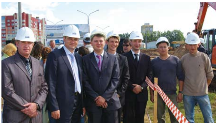
Коллектив «Литана-Строй» работающий в Беларуси

В целом программа развития розничной сети «ОМА» предполагает возведение еще нескольких современных торговых площадок в период до 2015 года.