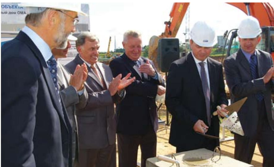
На торжественном мероприятии по закладке капсулы

8 сентября 2009 года в Минске заложена памятная капсула в фундамент нового строительного гипермаркета «ОМА». Он станет пятым по счету в сети соб-