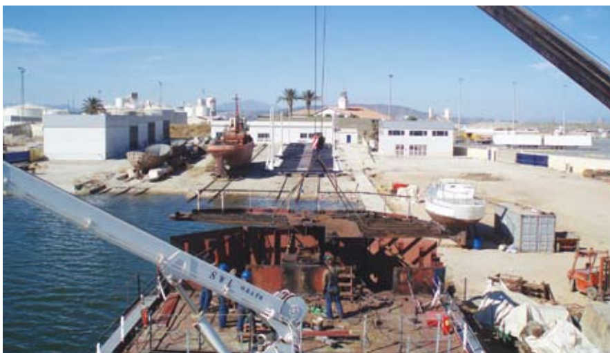
Работы по ремонту судоходной баржи (Испания)

Ремонтные работы усложняются погодными условиями: высокая влажность и температура воздуха. В течение всего лета столбик термометра не опустился ниже 39°C.