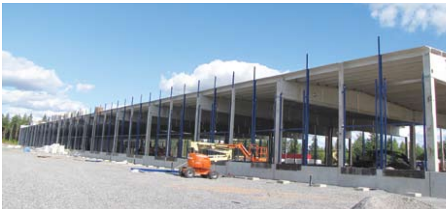
Строительство терминала логистики (Финляндия)

Работники группы «Litana» сегодня работают на терминале логистики Kaukokiito Oy, площадью 10000 м 2 , заказчиком которого является SRV Toimitilat Oy. Строительство терминала логистики начато в июле месяце, завершение планируется на октябрь. Этот объект – второй крупный проект, выполненный в этом году в Финляндии. Первый – это построенный в марте месяце в городе Турку торговый центр «Kauppakeskus Pilotti». На строительстве этого центра специалисты