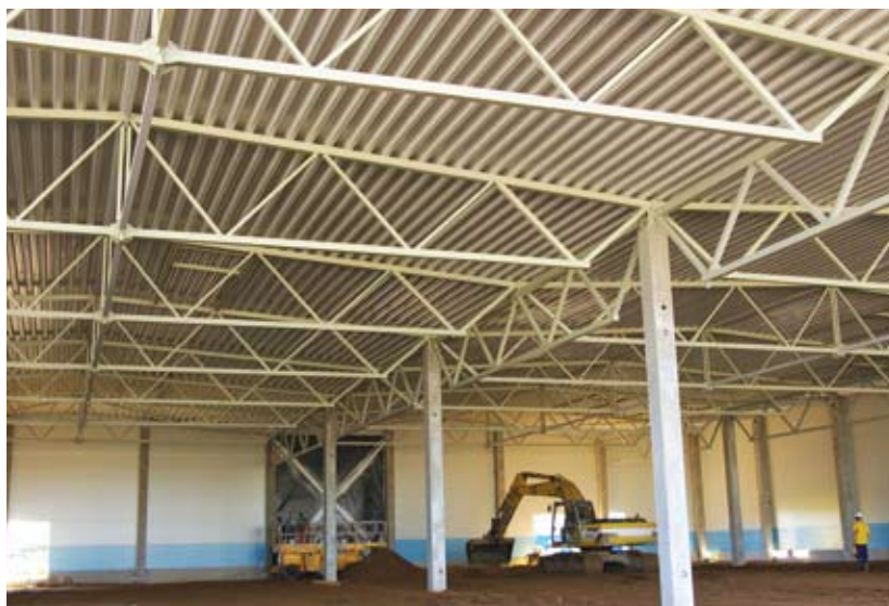
Строительство торгового центра «RIMI» в городе Клайпеда (Литва)

А также начнутся работы по изготовлению производственных линий и их монтажу на строящемся заводе по изготовлению ключей «ABLOY» в городе Йоенсу.