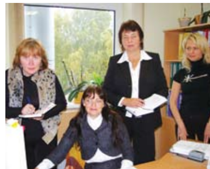
Во время семинара

ем в сфере финансов не остановится. В ближайшее время планируется передать необходимую для работы информацию главным бухгалтерам других филиалов, а так же будут проводиться консультации бухгалтеров, участвовавших в семинаре.