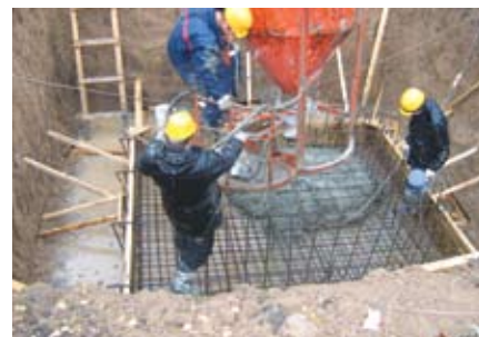
Строительство Регионального Распределительного центра в с. Стрельцы, Тамбовская область

ЗАО «Тандер», управляющая компания сети магазинов «Магнит», основана в 1994 году. Теперь сеть магазинов «Магнит» является лидером на рынке по количеству торговых объектов и территории их покрытия в России — 57 филиалов, более 2864 магазинов в более чем 922 городах и населенных пунктах. В настоящее время открывается несколько десятков мага-