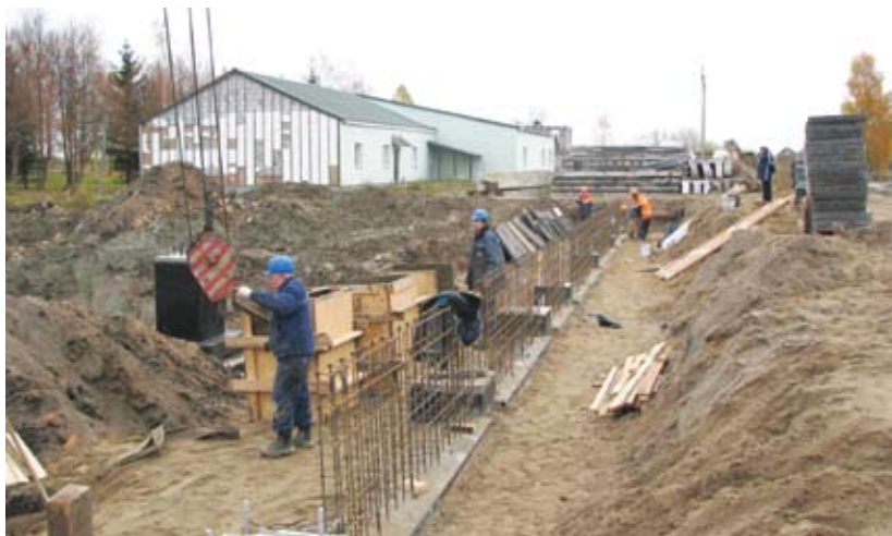
Строительство завода по производству лекарственных препаратов ЗАО «Инфомед» в Калининграде (Россия)

В ноябре начнутся работы по строительству Энергетического парка, площадью 1845 м 2 в финском городе Ussikaupunki.