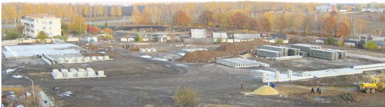
Площадь застраиваемой территории 12,5 Га.

зинов в месяц. В сети работает более 73 556 сотрудников. В магазинах «Магнит» продаются более 500 наименований товаров под частной маркой. Торговая площадь гипермаркетов варьируется от 2000 до 12 500 кв.м. Ассортимент насчитывает до 15 000 наименований товаров, из которых около 75% составляют продукты питания. Гипермаркеты размещаются в черте города, что делает возможным их посещение не только автовладельцами. На сегодняшний день строятся еще более 10 объектов. Кроме того, предприятие имеет крупный парк автомобилей и осуществляет междугородние перевозки грузов по всей европейской части России.