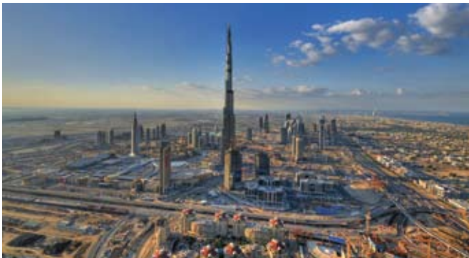
Burj Dubai (Бурж Дубай) - это грандиозное сооружение, состоящее из жилых, коммерческих, гостиничных, развлекательных и торговых комплексов среди воды, зелени и озер. Бурж Дубай — это самое высокое здание в мире (Дубайская башня): от 160 до 180 этажей. Сама башня будет состоять из жилых и офисных площадей, а также фешенебельного отеля.

Дубай (англ. Dubai) - крупнейший город Объединенных Арабских Эмиратов (ОАЭ), административный центр эмирата. Название эмирата переводится с арабского как «саранча, вылупившаяся из личинки». В городе живет около 1321,4 тыс. человек (на 2006 год).