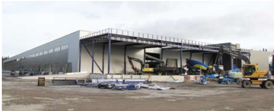
Строительство терминала логистики «Kaukokiito» Оу, площадью 10000 м 2 , в городе Турку (Финляндия)

9 ноября этого года специалисты группы компаний «Litana» начнут работы