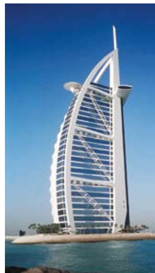
Отель Burj al Arab Hotel (Бурж Аль-Араб отель) образно называют «семизвездочным». Это самый высокий в мире отель (56 этажей, 321 м) возведен в море, в 280 м от берега на искусственном острове. Отель расположен в 15 км южнее Дубаи, является частью комплекса Jumeirah International.