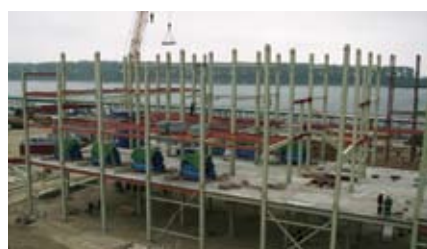
Подготовительный корпус завода ЗАО «Содружество-Соя»

- продолжение монтажа металлоконструкций подготовительного корпуса завода ЗАО «Содружество-Соя» совмес-