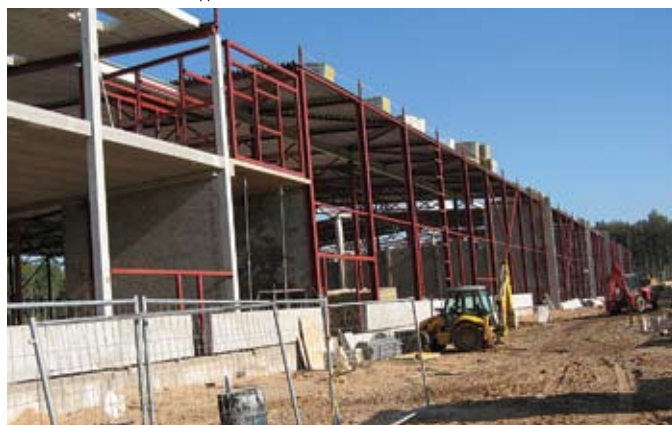
Строящийся центр логистики «Wellman»