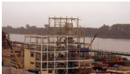
Корпус «рафинации» завода ЗАО «Содружество-Соя»

В октябре месяце планируется изготовить 586 тонн металлоконструкций для объектов, строящихся в Калининграде, Литве и Латвии. Планируемый объем работ по всей группе компаний «Litana» на октябрь месяц составляет 85600 часов.