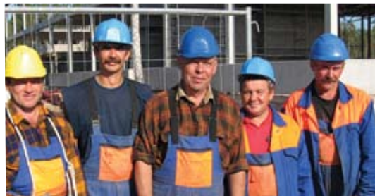
Рабочие на объекте «Wellman»