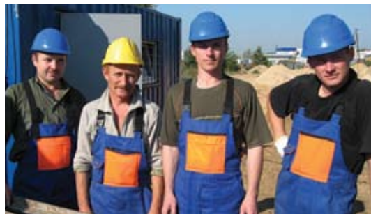
Рабочие на объекте «Paletes»