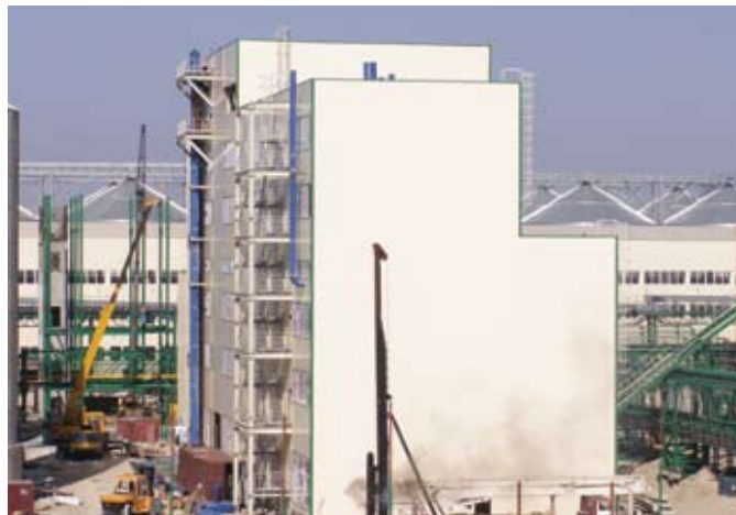
Подготовительный корпус ЗАО «Содружество – СОЯ». (Калининград)