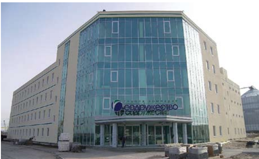
Административный корпус ЗАО «Содружество – СОЯ». (Калининград)