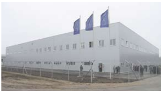
Завод по сборке бытовой техники компании «Эталон», 5000 м 2 , г. Гвардейск

9 февраля 2008 года в городе Гвардейске начал работу завод по сборке бытовой техники компании «Эталон». Его проектирование и строительство было выполнено в течение восьми месяцев. Группа компаний «Litana» работала на этом объекте в качестве генподрядчика.