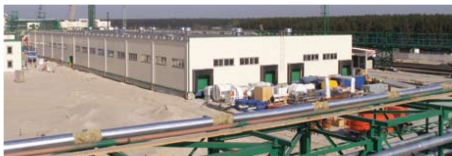
Склад вспомогательных материалов ЗАО «Содружество – СОЯ». (Калининград)