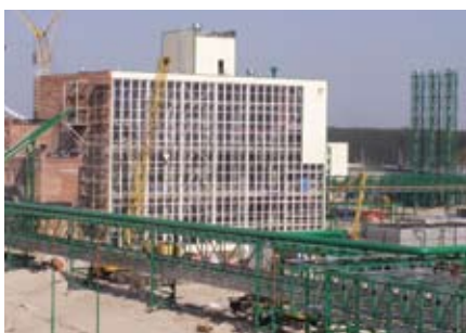
Экстракционный корпус ЗАО «Содружество – СОЯ». (Калининград)