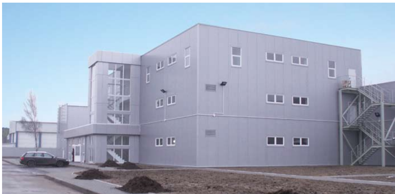
Окончание строительства рыбоконсервного комплекса фирмы «Роскон» (Калининград)

В Рижском районе, Марупе начнется строительство склада приправ с офисными помещениями «Basko».