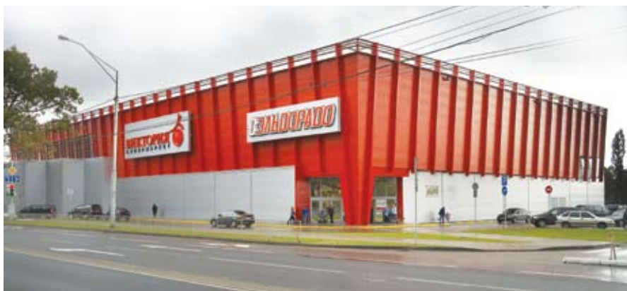
Торговый центр компании «Виктория». (Калининград)