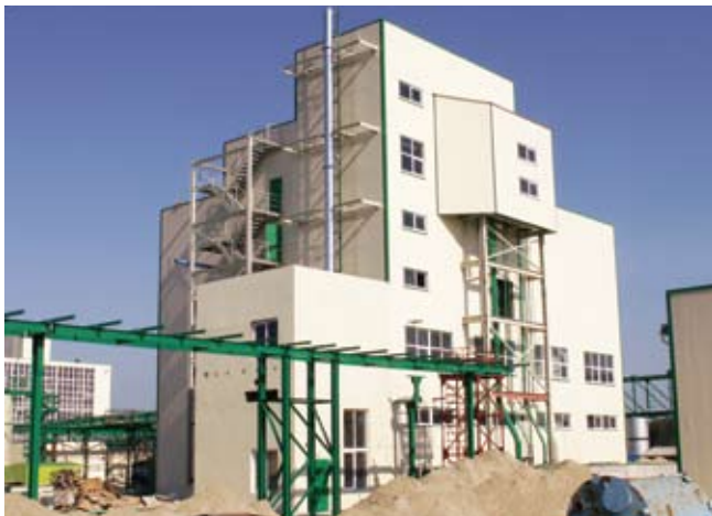
Цех комплексной очистки соевого масла ЗАО «Содружество – СОЯ». (Калининград)