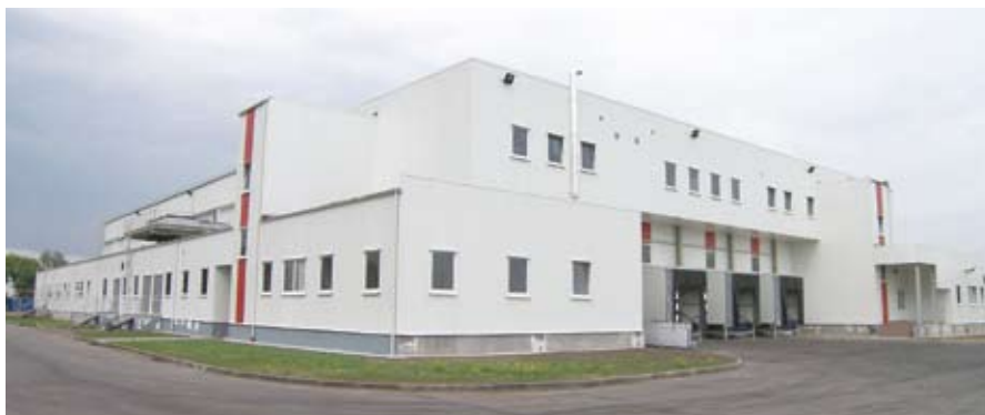
Склад-холодильник, площадью в 5300 м 2 (Калининград)