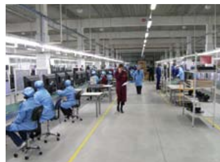
Завод начал работу.

9 февраля 2008 года в городе Гвардейске начал работу завод по сборке бытовой техники компании «Эталон». Его проектирование и строительство было выполнено в течение восьми месяцев. Группа компаний «Litana» работала на этом объекте в качестве генподрядчика.