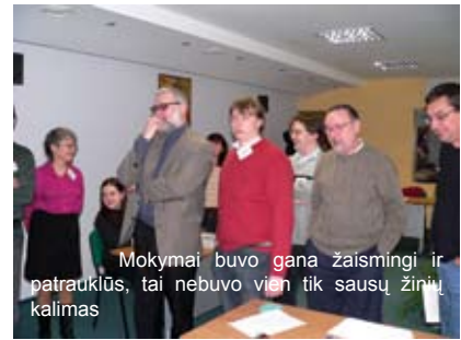
Mokymai buvo gana žaismingi ir patrauklūs, tai nebuvo vien tik sausų žinių kalimas

filmuojami. Vėliau, peržiūrėdami nufilmuotą medžiagą, analizavo savo veiksmus. Buvo puiki proga pažvelgti į save iš šalies.