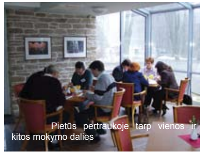
Pietūs pertraukoje tarp vienos ir kitos mokymo dalies