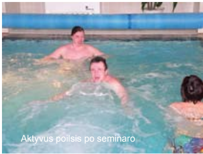
Aktyvus poilsis po seminaro