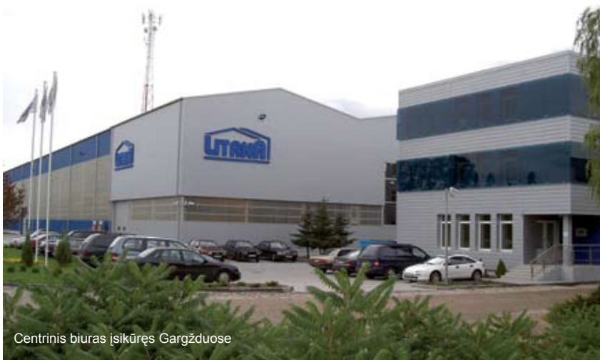
Centrinis biuras įsikūręs Gargžduose