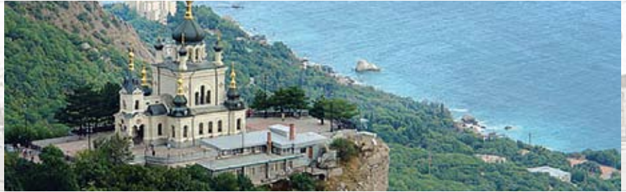
Украина. Крым. Форос. Храм Воскресения Христова

• Виза в Украину на срок, не превышающий 90 дней, гражданам стран Европейского Союза, Швейцарии, США, Канады и Японии не требуется.