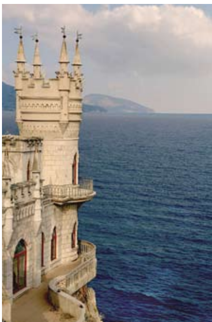
Украина. Крым. Гаспра. Визитная карточка Крыма ЛАСТОЧКИНО ГНЕЗДО

• Украина расположена в Восточной Европе и граничит по суше с Россией, Беларусью, Молдовой, Польшей, Словакией, Венгрией и Румынией. На юге омывается Черным морем, на юго-востоке - Азовским. В состав Украины входит автономная Республика Крым. Общая площадь - 603,7 тыс. кв. км.