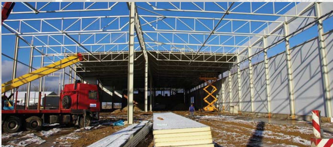
Строительство складских помещений ЗАО «Vitranca» (Литва)