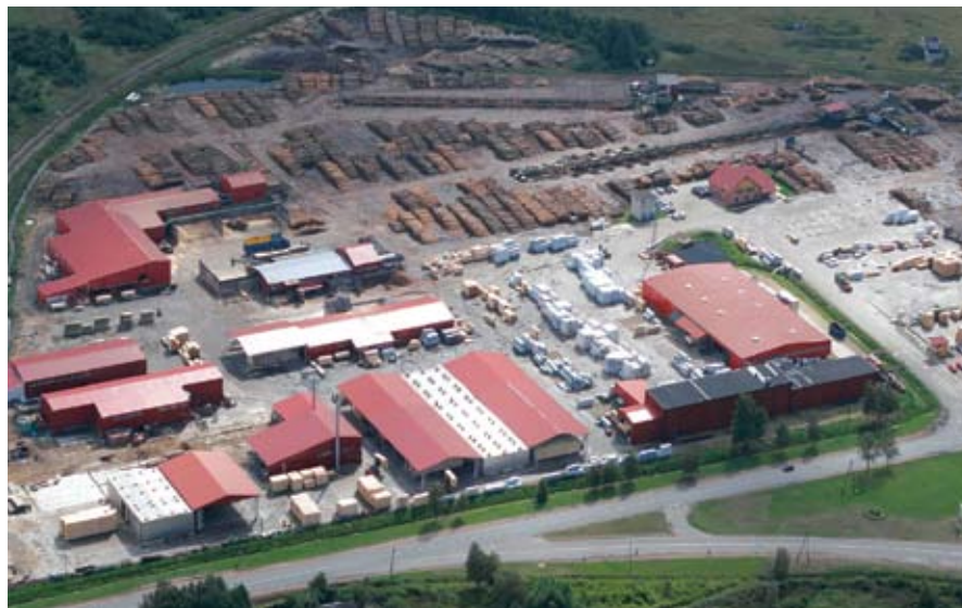
Деревообрабатывающий комплекс «Kurekss» (Латвия), почти все здания построены группой «Litana»

ных объектов: складов, цехов, котельных и различных пристроек. На расположенном в Вентспилсе деревообрабатывающем комплексе «Kurekss» работы велись ежегодно. Это не прерывающееся и слаженное сотрудничество, выстроенное на