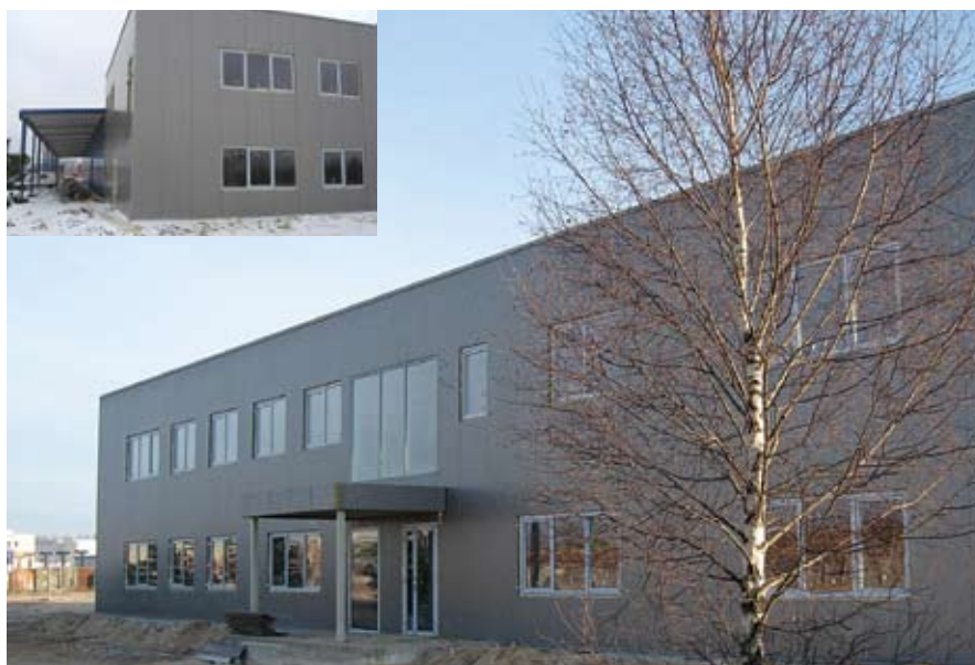
Строительство объекта «Paletes» (Латвия).