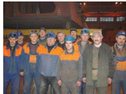
Lietuvos laivų statytojai