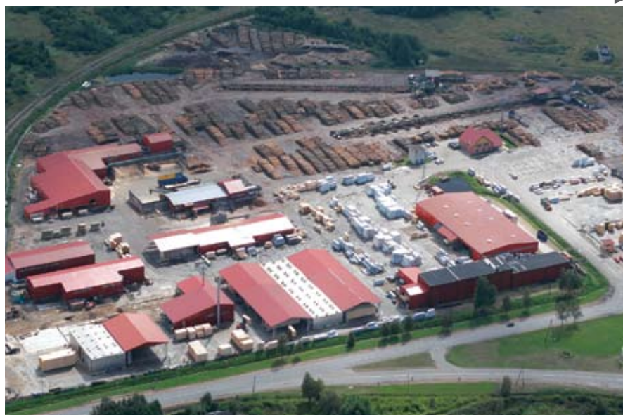
SIA „Kurekss“ - vienas iš didžiausių medžio apdirbimo kombinatų Latvijoje, beveik visus šiuos pastatus statė įmonių grupė „Litana“

tus: sandėlius, cechus, katilines bei įvairius priestatus. Ventspilyje esančiame medžio apdirbimo komplekse „Kurekss“ buvo dirbama kasmet. Šis nenutrūkstantis ir sklandus bendradarbiavimas buvo sąlygotas abipusio