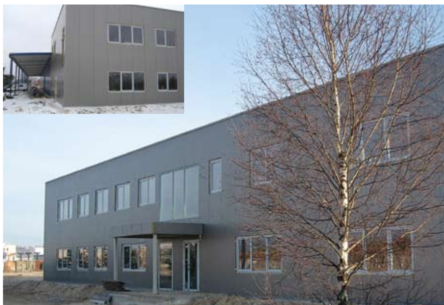
Statomas objektas „Paletes“ (Latvija)