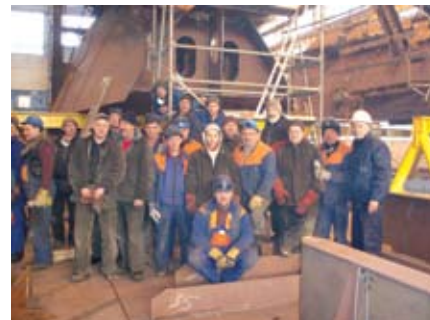
Lietuvos laivų statytojai

Nuo 2007 metų pradžios kas mėnesį kiekvieno padalinio, tapusio mėnesio nugalėtoju, darbuotojai bus apdovanojami piniginemis premijomis. Tai dar didesnis stimulas vykdyti planą pagal apimtis bei laikytis darbo ir technologinės drausmės. Visos pergalės reikalauja pastangų.