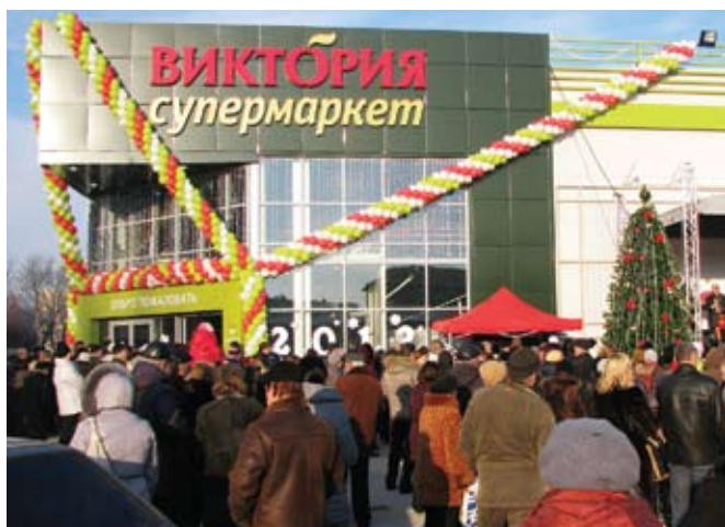
Открытие супермаркета «Виктория» в Калининграде.

Во Франции будут проводиться трубопроводные и корпусные работы на судостроительных заводах.