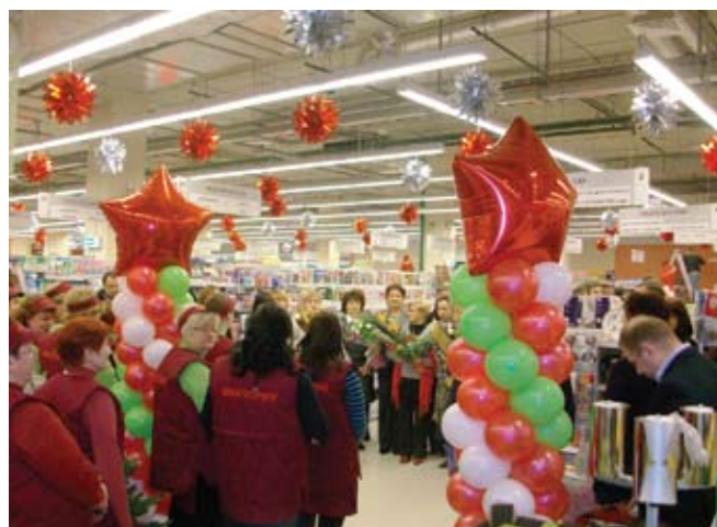
Открытие супермаркета «Виктория» в Москве.