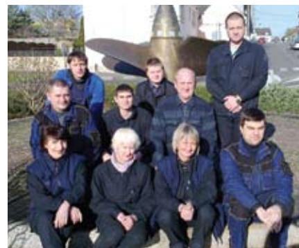
Работники «Litana-France» на судостроительном заводе в Лориенте.