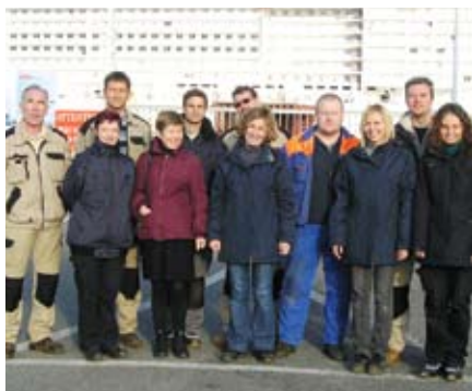
Работники «Litana-France» на судостроительном заводе в Сент-Назаире.

Руководство группы компаний «Litana» благодарит работников «Litana-France» за превосходные рабочие результаты и поздравляет их с завоеванием титула победителей 2011 года.